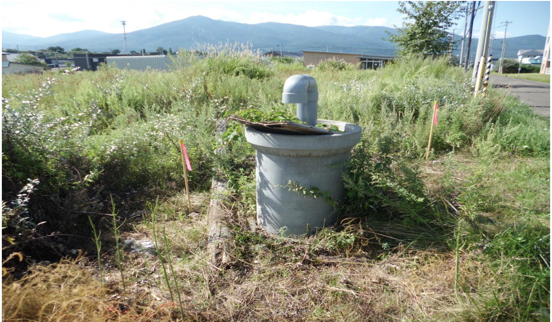
流雪溝の空気弁(土地東側から西側へ撮影)