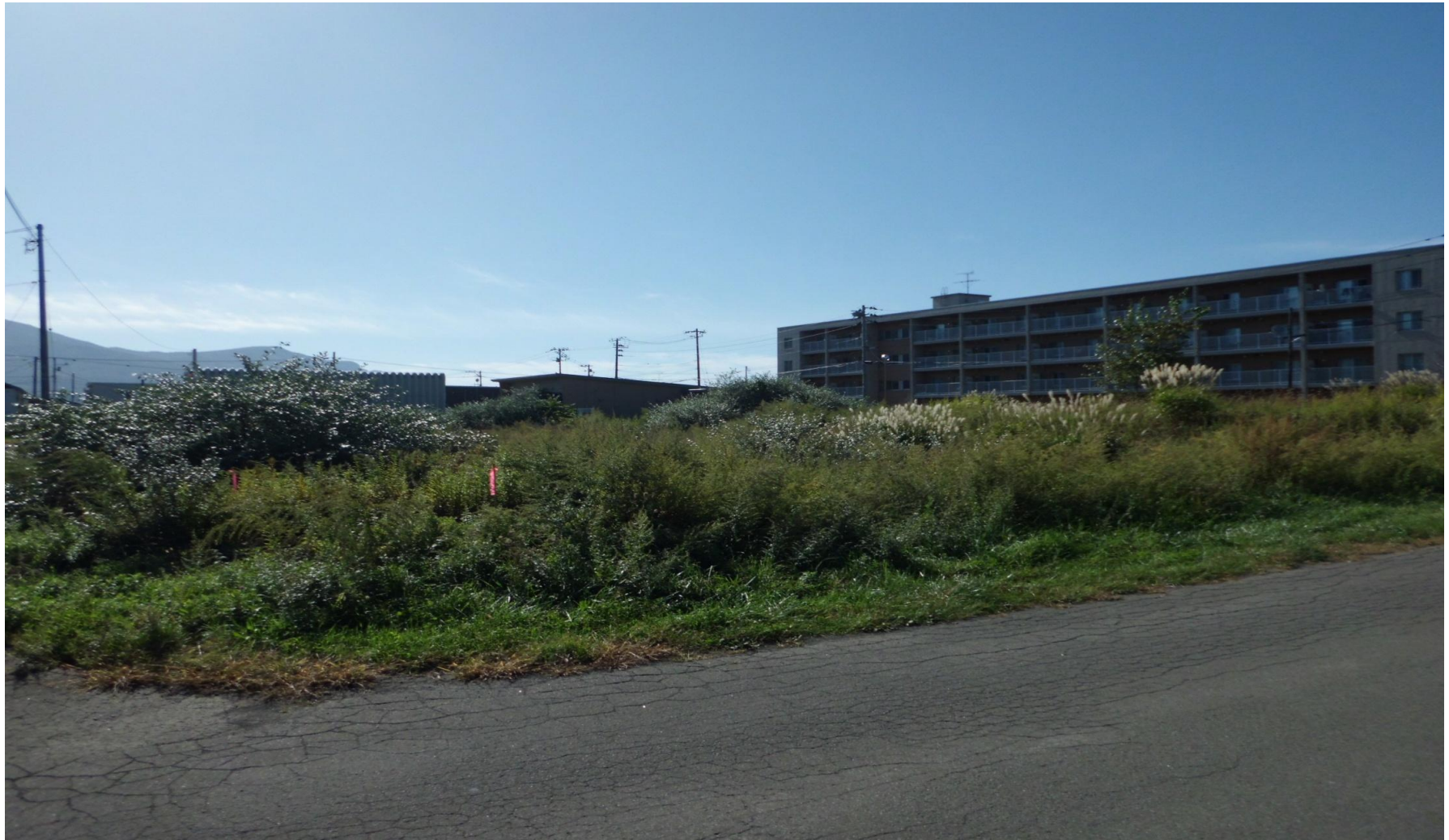
物件全景(土地東側から西側へ撮影)