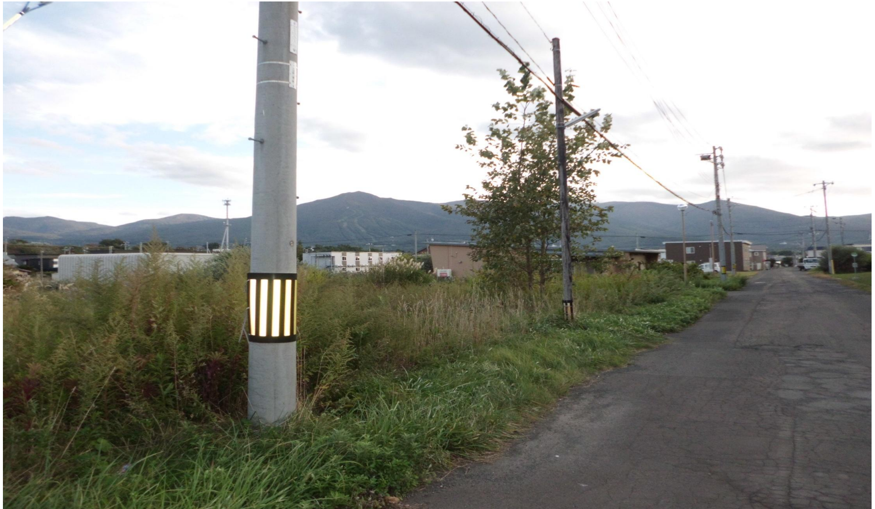
電柱(土地北側から南側へ撮影)