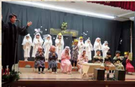
12月16日 岩内幼稚園クリスマス会