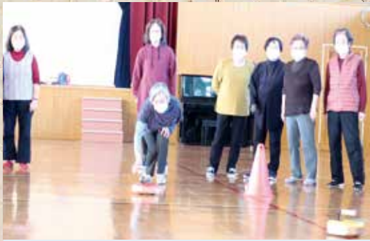
11月18日 フロアカーリング