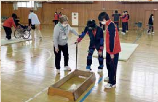
12月14日 第二中学校高齢者に関する学習