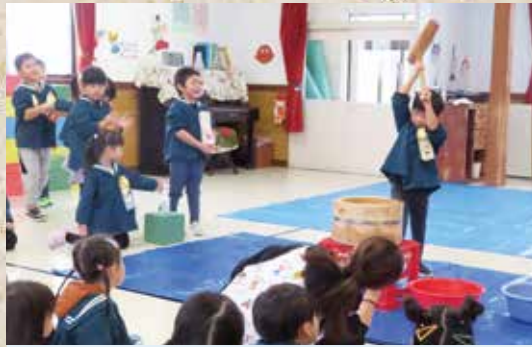
12月1日 高田幼稚園おもちつき