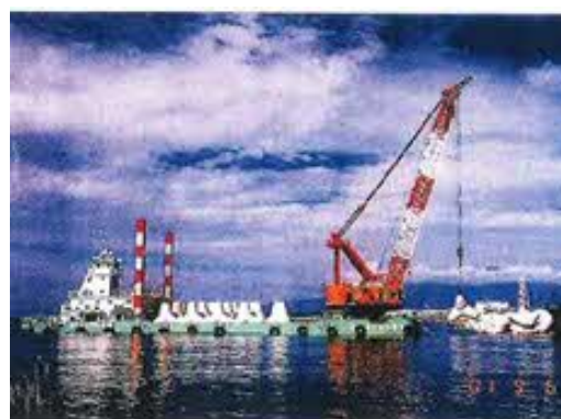
起重機船にて櫓を岩内港から曳航