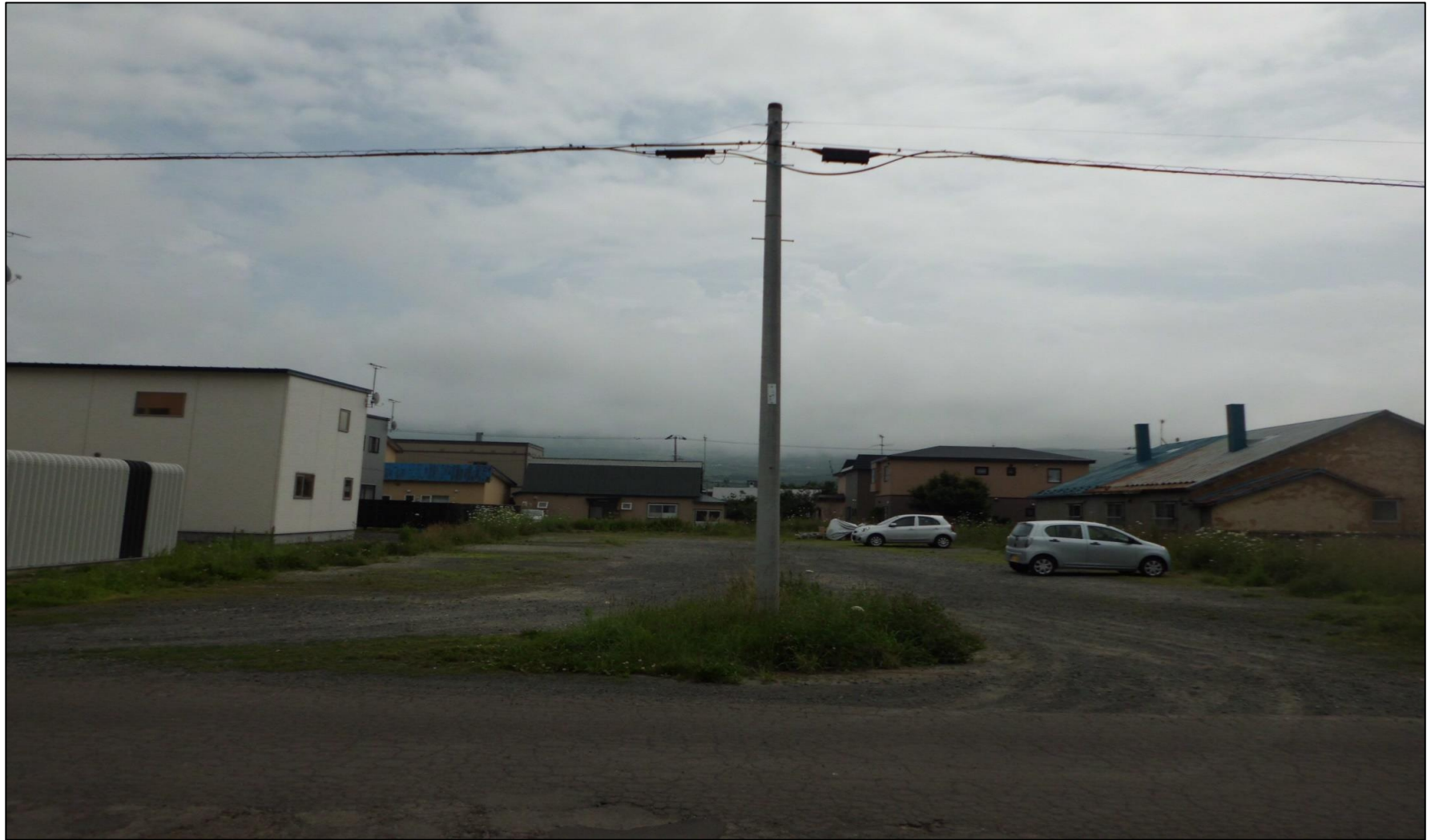
物件全景(土地北側から南側へ撮影)