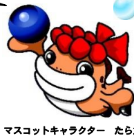
マスコットキャラクター たら丸

発行元：岩内町地場産業サポートセンター 岩内町字大浜476番地28 TEL0135-62-5180