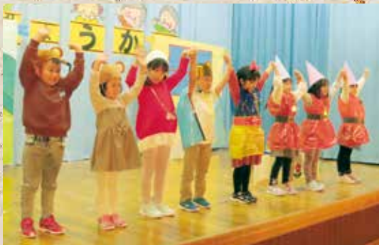
10月27日 東山保育所発表会「白雪姫」

吹奏楽と早口言葉の異色のコラボ。「生麦、生米、生卵♪」全員集合を知ってますか!?