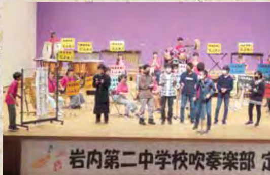
10月25日 二中定期演奏会

吹奏楽と早口言葉の異色のコラボ。「生麦、生米、生卵♪」全員集合を知ってますか!?