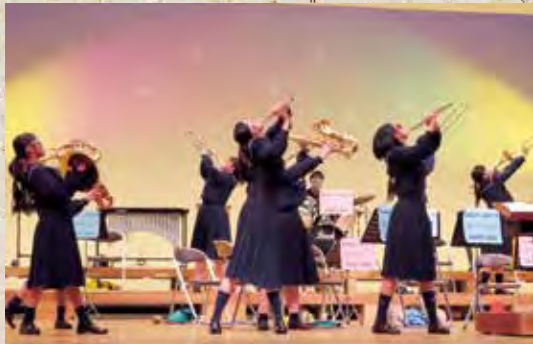
10月24日 一中定期演奏会