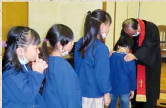
11月5日 岩内幼稚園子ども祝福式

子ども祝福式は、七五三にあたるもので、健やかに育つようにとの祈りが込められます。