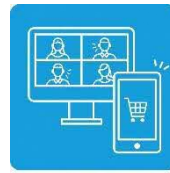
オンラインを 上手に使おう