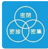
3つの「密」を さげよう