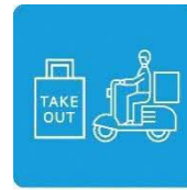
テイクアウトや デリバリーも