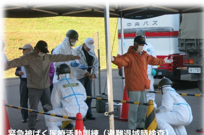
緊急被ばく医療活動訓練 (避難退域時検査)