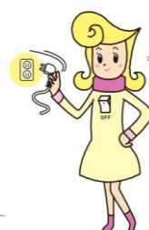
省エネキャラクター こまめさん