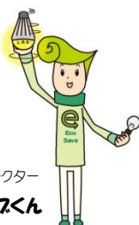
省エネキャラクター セーフくん