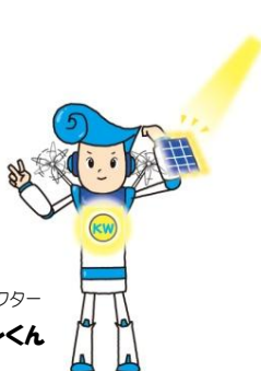
新エネキャラクター ネオンくん