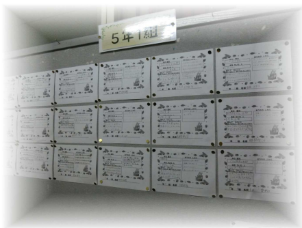
廊下に掲示「家読カード」