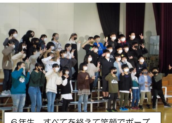
6年生 すべてを終えて笑顔でポーズ