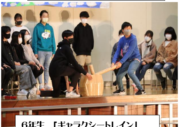
6年生 「ギャラクシートレイン」