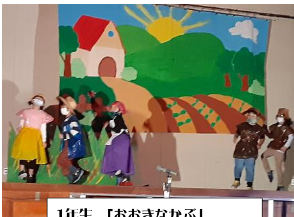
1年生 「おおきなかぶ」

本日は学芸会でした。 子どもたちは本番の発表を一生懸命がんばりました。 練習では上手にできなかったことを しっかりとやりとげた子がたくさんいました。 練習以上の演技ができた子もたくさんいました。 多くの子が行事を通して成長できたようです。