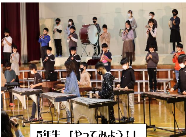
5年生 「やってみよう！」