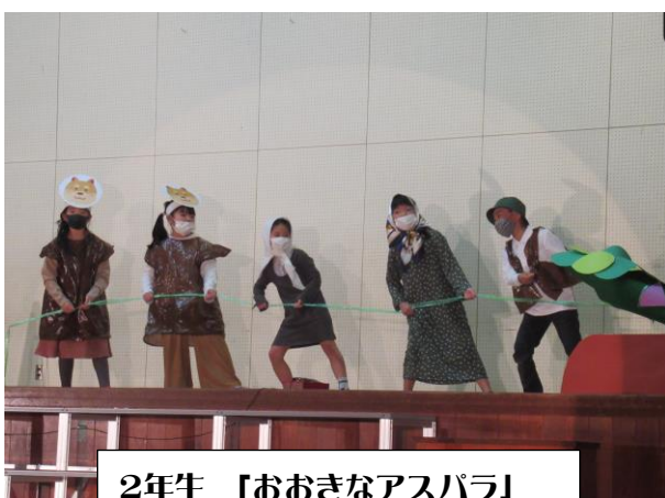
2年生 「おおきなアスパラ」

保護者の皆様、感染症対策を行いながらの行事開催に ご理解とご協力をいただきありがとうございました。