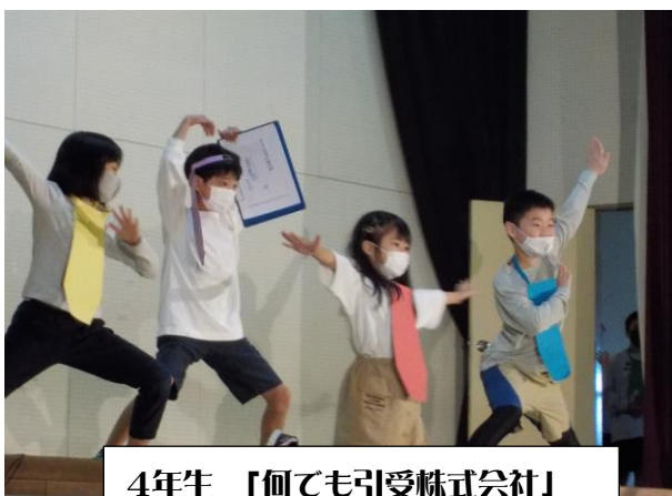
4年生 「何でも引受株式会社」