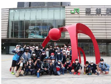
函館駅前 で記念撮影

修学旅行の実施するにあたり、保護者の皆様を始め、たくさんの方々にご理解、ご協力をいただきました。誠にありがとうございました。