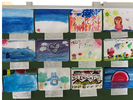
3年 「絵具と水のハーモニー」