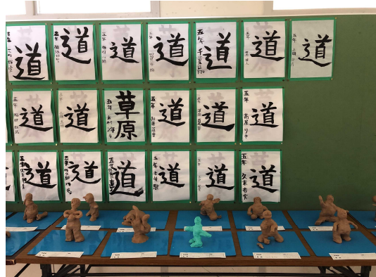
5年 毛筆「道」 立体「〇〇している人」