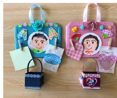
つくし学級 「プレゼント」