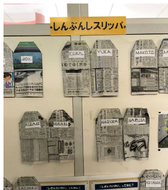
あさがお学級 防災学習 「しんぶんスリッパ」