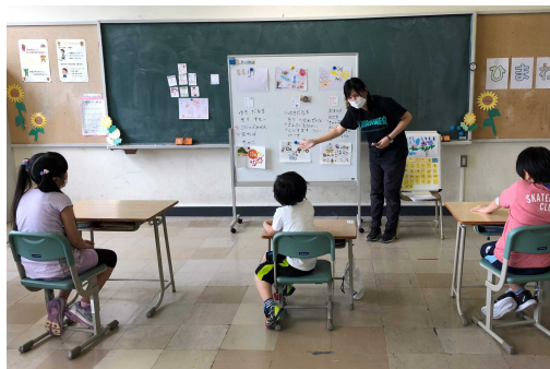
ひまわり学級 「カレンダー作り」 互いに相手の気持ちを考えながら 話し合いました。