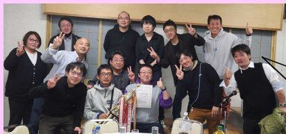
表彰式(懇親会)にて記念撮影。