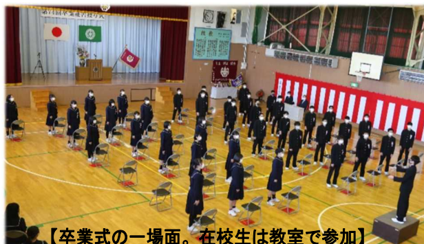
【卒業式の一場面。在校生は教室で参加】