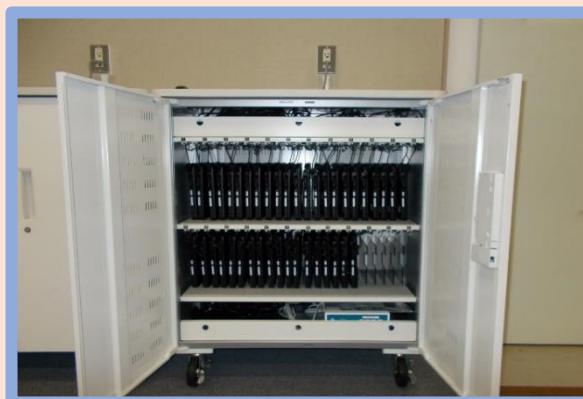
保管庫の中の様子