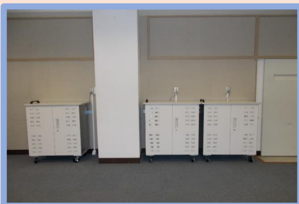
パソコン室に保管しています

先月、生徒用タブレット PC 計 134 台が導入されました。それに伴い、昨日、その操作方法やアプリの使用法の説明を行う講習会を実施しました。子供たちは、初めて手にとって触るタブレット PC に興味津々でした。タブレット PC は、今後の授業や調べ学習等に有効活用していきます。