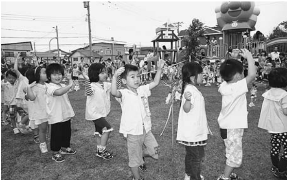
7月25日 高田幼稚園七夕踊り 短冊には「おほしさまとおしゃべりしたい」「うまいぼうが100コたべられますように」などの願いごと。みんな叶うといいですね。