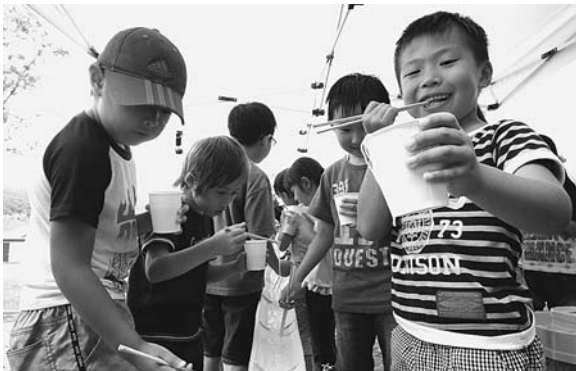
8月7日 西小学校学童「そうめん流し体験」 下の方でなかなか流れて来ないそうめんをやっとキャッチしてどや顔の児童。 ほら、ほら、次のそうめん逃しちゃうぞ。