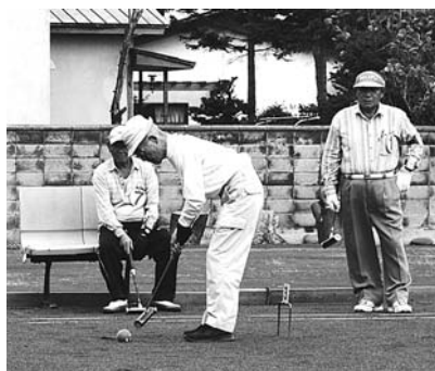
8月12日 町民ゲートボール大会 台風一過の青空のもと、司令塔が出す適切な指示の声とスティックで球を打つ音が鳴り響いていました。