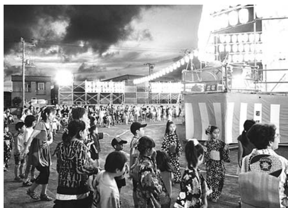
8月15日 北海盆踊り 定番の「子ども盆踊り唄」が流れる中、浴衣を着た方や仮装した方などが、大きな踊りの輪を作っていました。