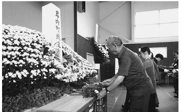
8月8日 戦没者追悼式 戦争で犠牲になられた方々を追悼するとともに、二度と戦争が起こらないことを願い、参列者の皆さんが戦没者の霊前に花をたむけました。