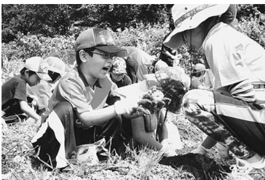
8月10日 小学生いも掘り体験 子どもたちは、「ここにもあった」「こっちのいもは大きいよ」と夢中でいも掘りを楽しんでいました。