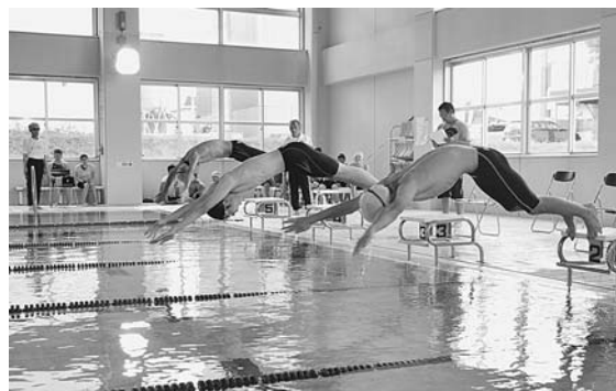
8月12日 町民水泳大会 飛び込み台から華麗にジャンプし、自由形、平泳ぎ、バタフライに挑む選手たち。東京オリンピックに向けて一位を目指せ！