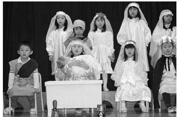
12月8日 岩内幼稚園「クリスマス会」 エンジェル組の園児たちが心を一つに、今から2000年前のキリストの誕生を聖歌やナレーションによる聖誕劇にして、披露してくれました。