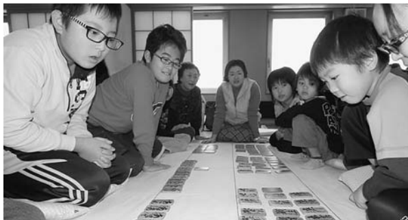
12月8日 下の句カルタで遊ぼう よまれた札を必死に探すふたり。奥のみんなはもう見つけたよ。「ほら、すぐ側にあるよ」。意外に自分の近くは盲点だったようです。