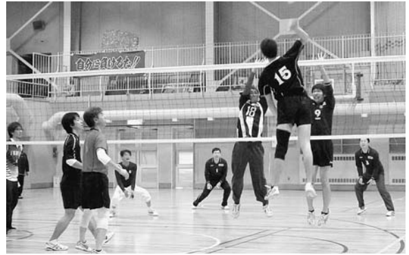
11月25日 町民バレーボール大会 男子チームにも高年齢化の波が押し寄せる中、勝負は若きエースに軍配があがりました。