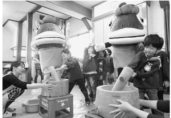
12月1日 高田幼稚園「もちつき大会」 たら丸とべに子の声援を受け、もちつきをする園児たち。ひと仕事終了後は、つきたてのおもちをおいしそうにほおばっていました。