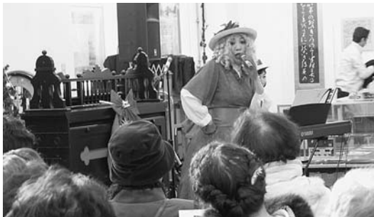
11月25日 郷土館いくベコンサート オルガン&ギターの演奏と、シャンソンを楽しんだ後は、特大ケーキににっこり。心もお腹も大満足のクリスマスになりました。