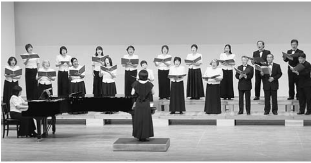
11月24日 しおさい定期演奏会 澄んだ女声と力強い男声が、混成合唱ならではの美しいハーモニーを奏で、歌う楽しさが会場まで伝わってくるステージでした。