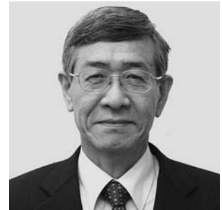
岩内町長 上岡 雄司