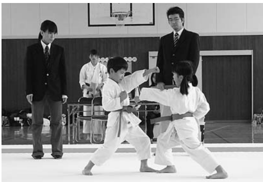
12月9日 岩内空手道親善大会 真っ白な道着を身にまとい、気合いを入れてビシッ！と型を決める凛々しい姿は武道家そのもの。みんな格好良かったよ！