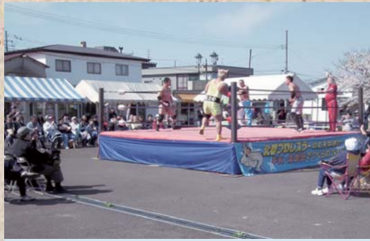
5月4日 タラ丸市場20周年記念イベント 20周年を記念し、北都プロレスが来場。 激しい肉弾戦が観客を盛り上げました。