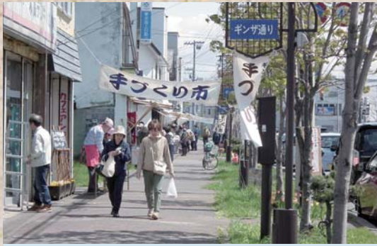
5月3日 ギンザ通り商店街「手づくり市」 少し風が強い日でしたが、客入りは上々。 お目当て品は手に入れられましたでしょうか。