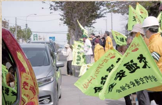
5月14日 春の交通安全運動 交通安全運動恒例の人と旗の波。皆さん、 交通ルールを守り安全運転をお願いします！