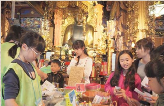
5月6日 駄菓子屋楽校in帰厚院 一生懸命お仕事してGETしたピースで駄菓子を購入！売り子さんはお仕事中です。