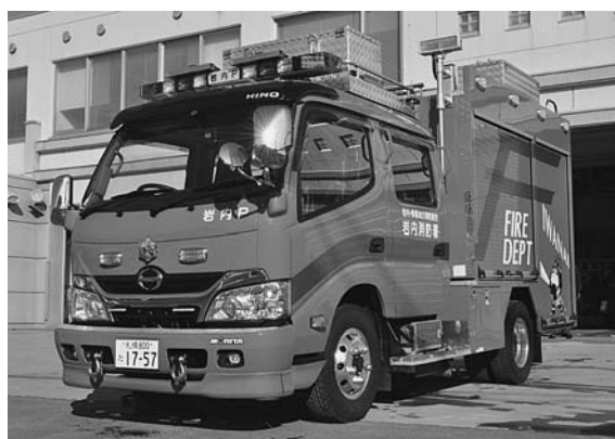
いつでもお気軽に見学にお越しください。

岩内消防署の消防ポンプ自動車を更新されました。主な設備は中型車に600ℓの水槽、泡を吐出する装置や救助資機材も搭載しています。また、防火衣を着用しているたら丸のデザインも新たに貼付しています。導入にあたり、緊急消防援助隊(緊援隊)への登録を行うことで交付される補助金を一部に充てました。緊援隊は災害が発生した場合に全国の消防から被災地に出動し、各種活動を行うものです。