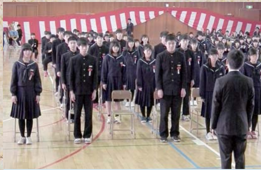
3月15日 第二中学校卒業式 卒業おめでとうございます。みなさんの成長ぶりに、つい目を細めてしまいました。