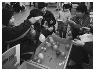
ひもが切れたら即アウト! ドキドキのヨーヨー釣り

3月17日(日)「春の深層水まつり」が開催されました。 バラエティ豊かなグルメコーナーやタッチプール、サンゴの水槽展示などを 行い、たくさんの方が来てくれました。