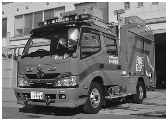
いつでもお気軽に見学にお越しください。

岩内消防署の消防ポンプ自動車を更新されました。主な設備は中型車に600ℓの水槽、泡を吐出する装置や救助資機材も搭載しています。また、防火衣を着用しているたら丸のデザインも新たに貼付しています。導入にあたり、緊急消防援助隊(緊援隊)への登録を行うことで交付される補助金を一部に充てました。緊援隊は災害が発生した場合に全国の消防から被災地に出動し、各種活動を行うものです。