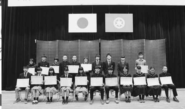
平成30年度岩内町スポーツ・芸術文化表彰式

今年度はスポーツ表彰16個人4団体、芸術文化表彰20個人4団体の方々が受賞 されました。(芸術文化表彰は、今年度から新たに設けられました。)