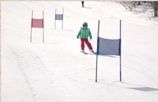
3月3日 スキー大会 緊張しないで思い切り滑れたかな？はたして、結果は…記録更新！？