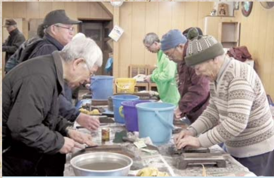
2月17日 包丁・はさみ研ぎ 職人さんのご奉仕により新品同様の切れ味に生まれ変わります。ありがとうございます。