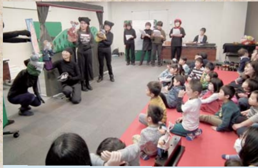
3月2日 絵本館ひなまつり 「ももたろうプロジェクト」さんによる人形劇に釘付け。楽しいひとときでした。