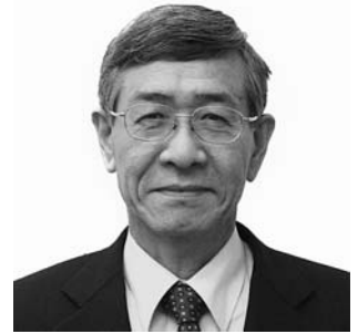
岩内町長 上岡 雄司