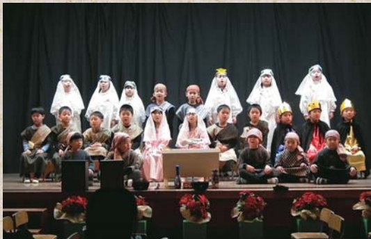
12月8日 岩内幼稚園クリスマス会 キリストが生まれたときのお話を劇で披露 してくれました。