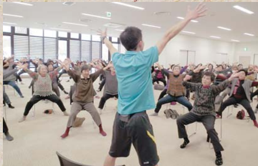
12月12日 はつらつ元気塾 「継続は力なり」みなさんの「はつらつ度」が アップしてます。まるでダンスのようです！