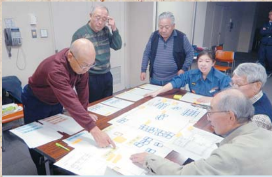
11月25日 地域防災力向上セミナー 受付はどこにする？ベットのどうする？… 避難所運営をカードゲームで体験しました。