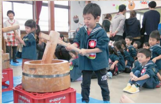
12月8日 高田幼稚園おもちつき大会 ちょっぴり早いお正月気分。楽しいけどお ずかしい〜っ。