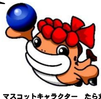
マスコットキャラクター たら丸