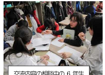
交流内容の相談中の6年生

○卒業大作戦：6年生が下級生の希望をきき、下級生のために交流する活動を行います。3月4日～7日まで、〇×クイズ、ドッジボール、給食などで交流します。6年生は、グループごとに準備を着々と進めています。