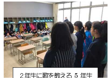
2年生に歌を教える5年生

○6年生を送る会：この会の運営は毎年5年生が担当しています。会で下級生が歌う曲「友よ」を5年生が選び、全クラスに教えに行きました。全校で朝や帰りに練習している声が響いています。また、会の最後には、6年生が、お礼に「TOMORROW」を演奏します。現在、練習も順調に進んでいます。