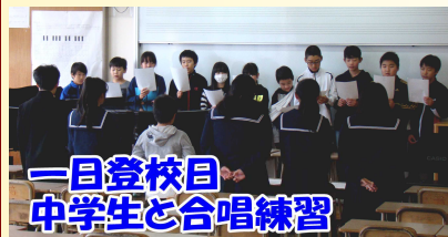
一日登校日 中学生と合唱練習